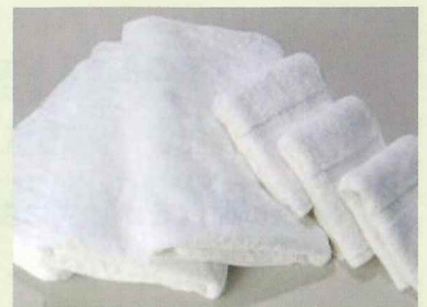
【バスタオル・フェイスタオル】