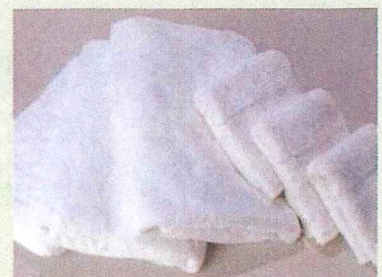
【バスタオル・フェイスタオル】